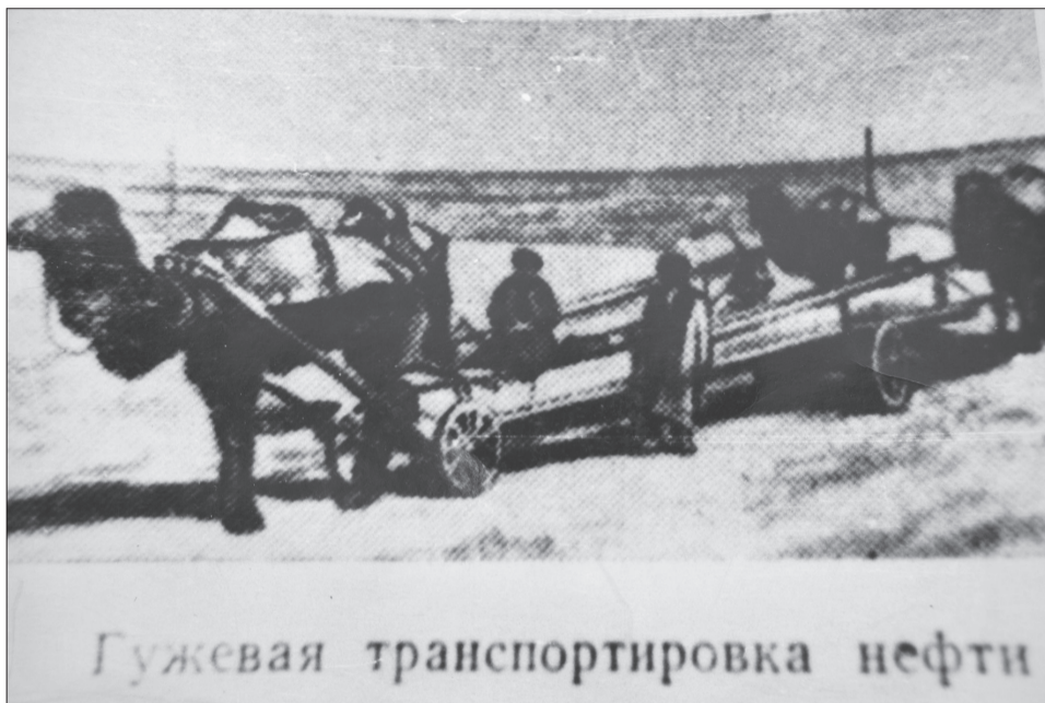
Гужевая транспортировка нефти

В связи с текучестью кадров, на промыслах «Эмбанефти» применялся труд подростков, чему было также уделено место в коллективном договоре 1923 года. Их допустимое количество определялось в 6%