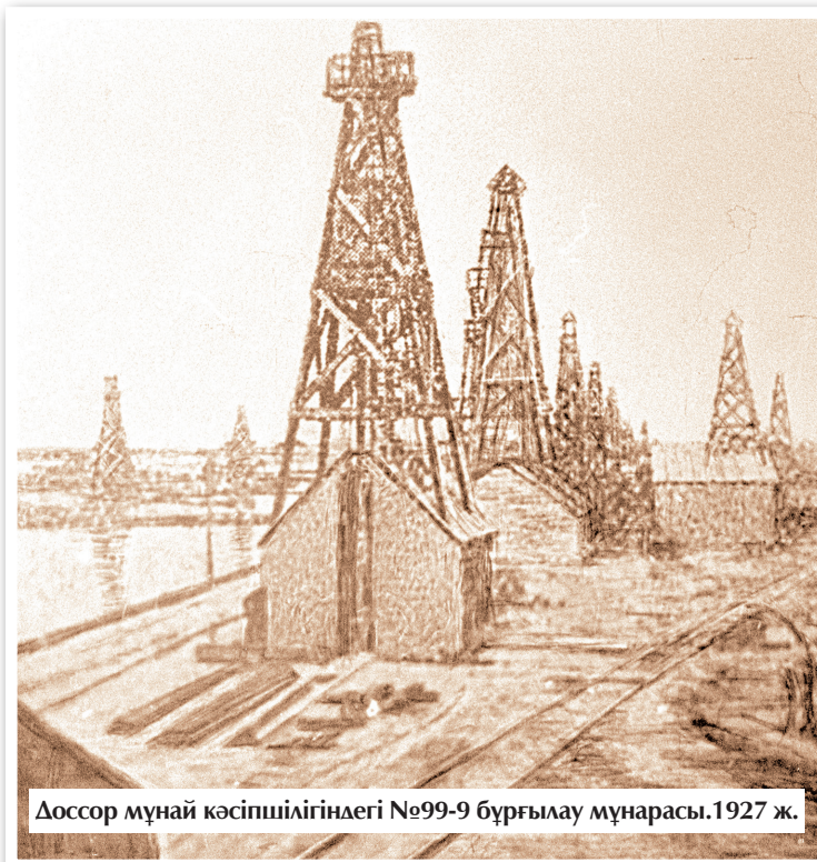
Доссор мұнай кәсіпшілігіндегі №99-9 бұрғылау мұнарасы. 1927 ж.

1931 – Байшонас кен орны ашылды. «Ақтөбемұнайбарлау» тресі жүргізген бұрғылау жұмыстарының нәтижесінде Ақтөбе облысында Шұбарқұдық кен орны ашылды.