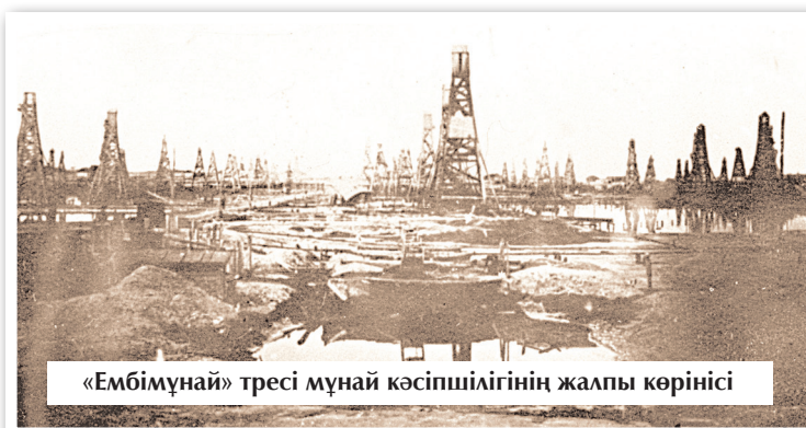
«Ембімұнай» тресі мұнай кәсіпшілігінің жалпы көрінісі