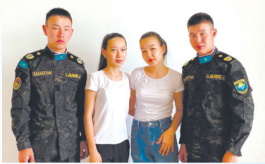
МҰНАЙШЫНЫҢ ОТБАСЫНДАҒЫ ТӨРТЕМНІҢ ТАҒДЫРЫ