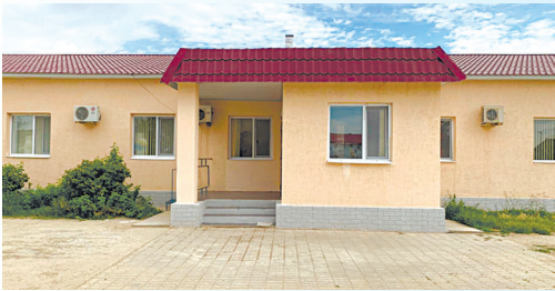
КҮРДЕЛІ ЖӨНДЕЛГЕН ЖАТАҚХАНА