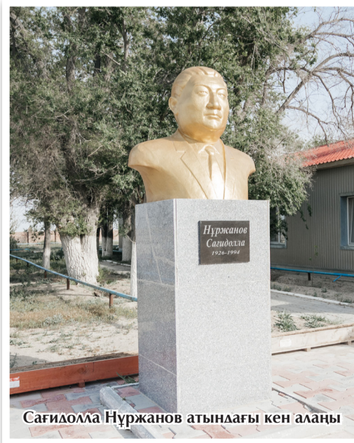
Сағидолла Нұржанов атындағы кен алаңы