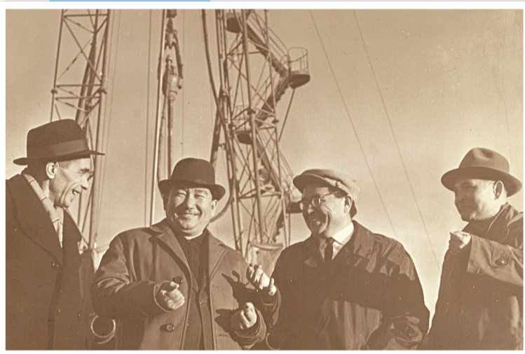
Бұл бетте пайдаланылған суреттер С.Нұржановтың обасылық және мұрағатталған алынған