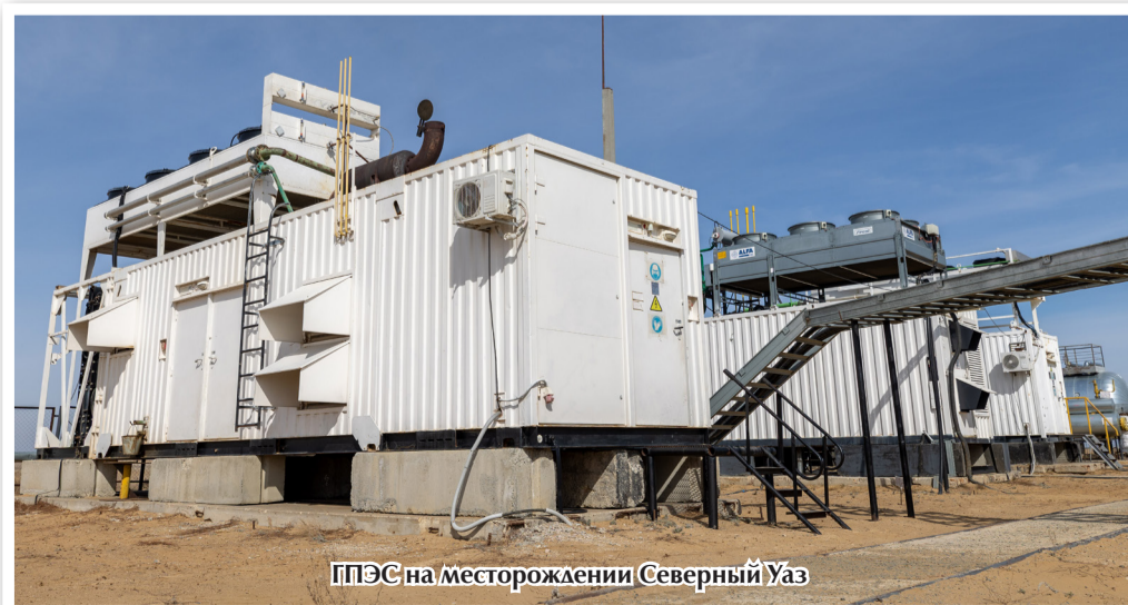
ГПЭС на месторождении Северный Уз

снижению зависимости от внешних источников энергоснабжения и сокращению затрат на покупку электроэнергии. По оценкам специалистов, экономия может достигать 55 процентов.