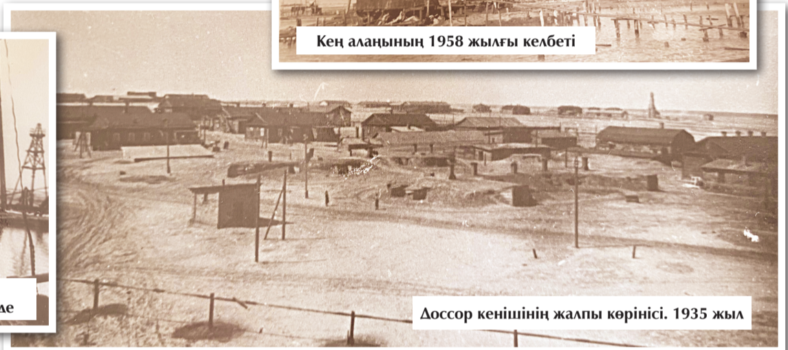
Доссор кенішінің жалпы көрінісі. 1935 жыл