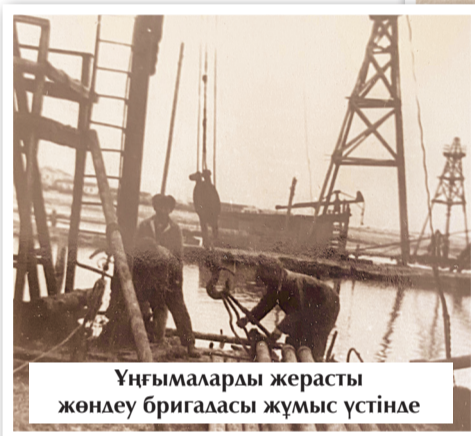
Ұңғымаларды жерасты жөндеу бригадасы жұмыс үстінде

Доссорда жұмысшы табы қалыптасып, кейіннен жергілікті халықтың ішінен оқыған мұнайшы инженер мамандар шыға бастады. Экономикадағы өзгерістер әлеуметтік жаңалықтар да ала келді. Біріншіден, кен орындарын иеленгендердің шақыруымен Ресейдің түкпір-түкпірінен маман жұмысшылар келіп қоныс тепті. Бұл аймақтың ұлттық құрамын өзгертті. Екіншіден, жергілікті халықтың өкілдері өндіріске бет бұрып, ата кәсіппен қоштаса бастады. Бұрғышы, мұнай өндіруші, ұста, жөндеуші, жүргізуші тағы да басқа мамандықтарды игеріп,