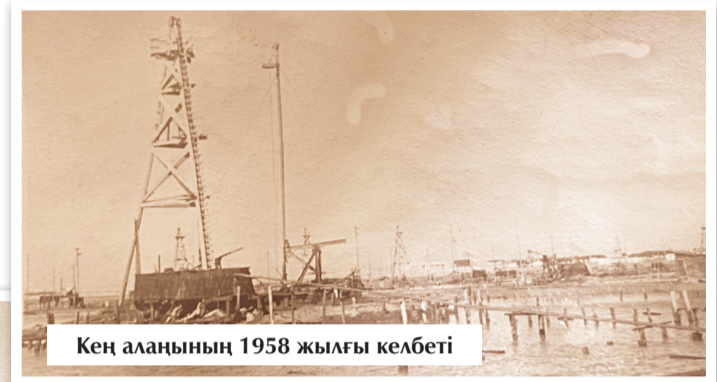
Кең алаңының 1958 жылғы келбеті

Мұнайшылар осы уәденің үдесінен шыға алды. Ұйымшылдықпен еңбек етіп, майдан сұранысын артығымен орындауға жұмылды. Өндірісті