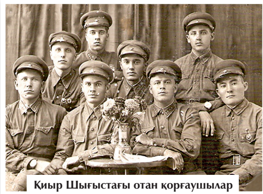
Киыр Шығыстағы отан қорғаушылар