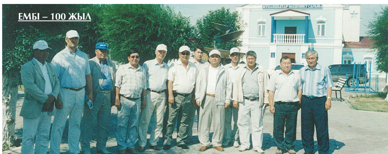
ЕМБІ – 100 ЖЫЛ

1990 жылы «Ембімұнайгаз» бірлестігі 2-қабатты қамыстан салынған ғимаратта орналасқан еді. Тозығы жеткен 1960 жылдары салынған. Жаңа ғимарат тұрғызу қажеттілігі туды. 1991 жылы жаңа ғимараттың құрылысы басталып, 1993 жылы қазан айында іске қосылды, 4-қабатты тастан салынған ғимарат пайдалануға берілді. 90-шы жылдары Мұнайшы мөлтек ауданында 9-18 пәтерлік баспана құрылысы салынып жатты. Сонымен қатар, қала ішінде екі балабақша салынып жатты. Бір 40 пәтерлік, бір 55 пәтерлік 5 қабатты