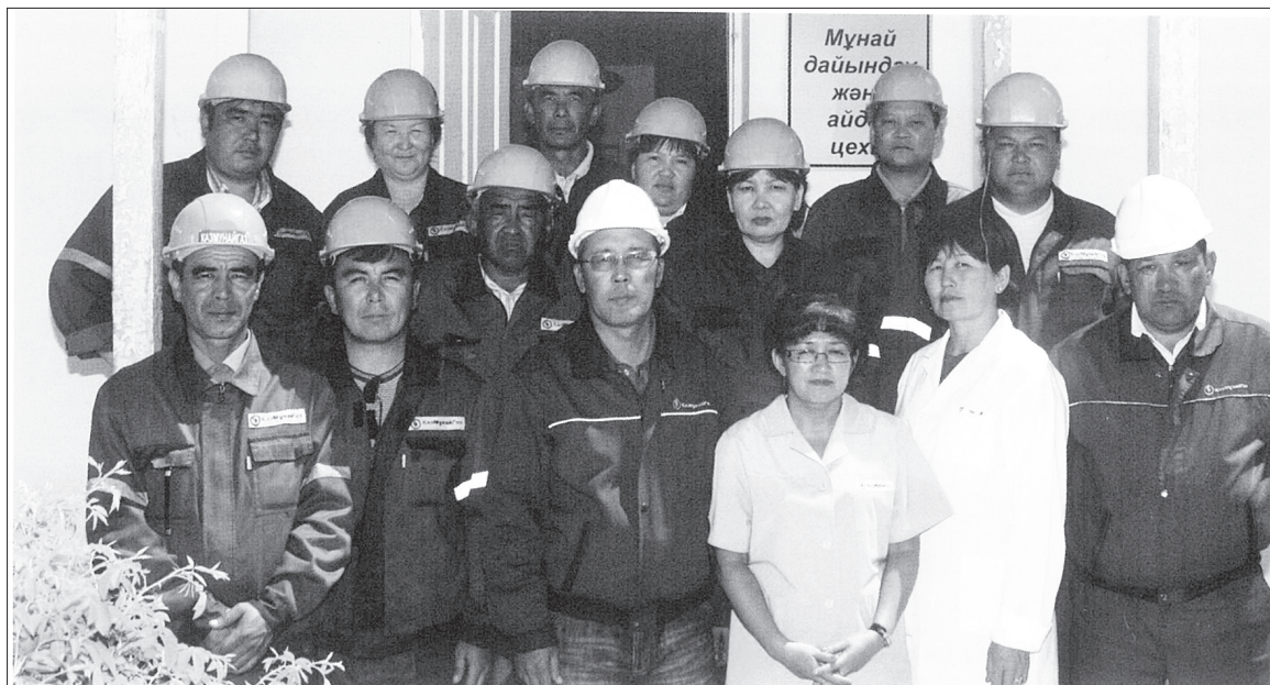
Қарсақ мұнайды дайындау және айдау бригадасының ұжымы (мұрағат)

Қарсақ кен алаңы жаңадан игерілуге берілгенде мен осы кеніштің көлік жүргізушісі болдым. Көлікпен мұнай мен су тасыдым. Ол кезде құбыр деген жоқ. Өнімді көлікпен тасыдық. Қарсақтың майын Байшонас арқылы Солтүстік учаскеге жеткізетінбіз. Жол жоқ қара жолмен, сорлардың арасымен күніне 3 рет рейс жасаймын, әр сапарымда 4 тоннадан мұнай тасымалданады. Сонымен қатар, Ескенеден Қарсаққа ауыз су тасыдым. Ол кезде Атырау (Гурьев) қаласынан Ескене стансасының аралығында су құбыры болатын. Ескенеден суды көлікпен тасыдық.