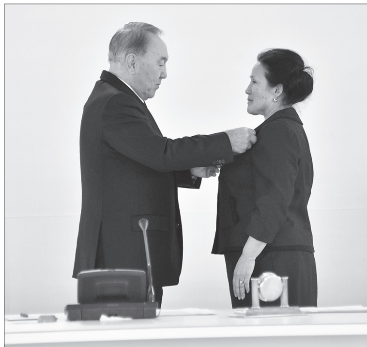
Еңбектің өленгені көпке үлгі

Міне, 60 жыл терең тарих үшін аз ғана уақыт болғанымен, осы уақыт аралығында Қарсақ кен орнында талай мұнайшы ұрпақтары алмасты. Үлкен кен орнының тарихы өрбіді, білікті мамандар дайындалып, мұндағы мұнайшылардың ерен еңбегінің арқасында ел экономикасының артуына сүбелі үлес қосылды. Майтапман мұнайшылардың абыройлы еңбегі кейінгі буынға үлгі болып қала бермек.