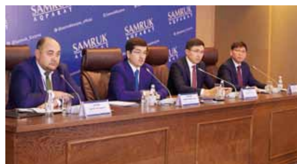
2018 жылы «Самұрық-Қазына» ӨАҚ» АҚ табысы 30% дейін ұлғайды 2 бет