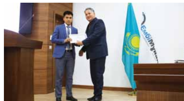
«Нұр Отан» партиясының 20 жылдығы: жасампаздық және әлеуметтік даму кезеңі 7 бет