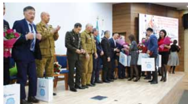
Ерлік ешқашан ұмытылмайды 4 бет