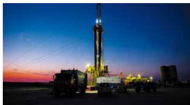
«Жайықмұнайгаздағы» тың жаңалықтар болашаққа деген сенімді арттырады 3 бет