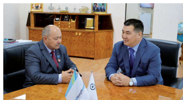
Әке жолын жалғаған ер 6 бет