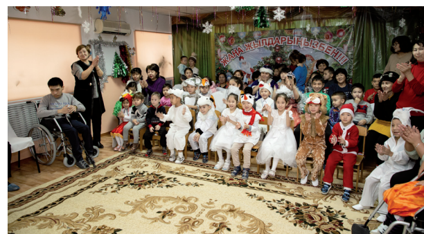
Ембілік мұнайшылардан жаңа жылдық ертеңгіліктер 7 бет