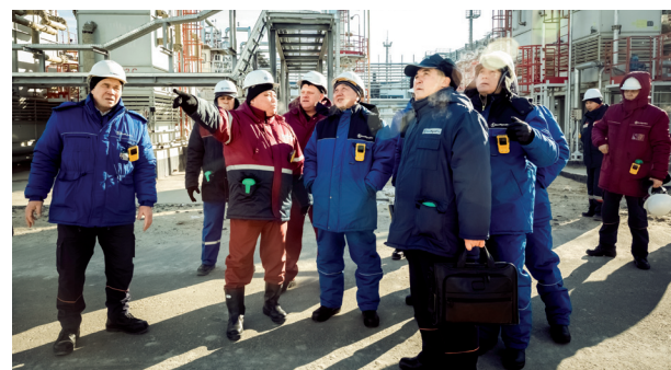
ҚМГ ҰК басшысы – Атырауда 4-5 беттер