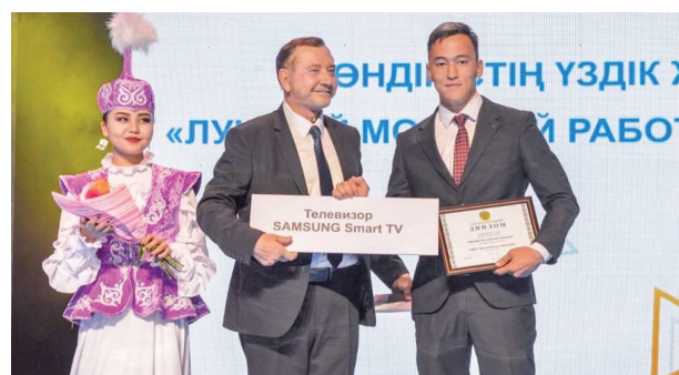
2018 жыл несімен есте қалды? 8 бет