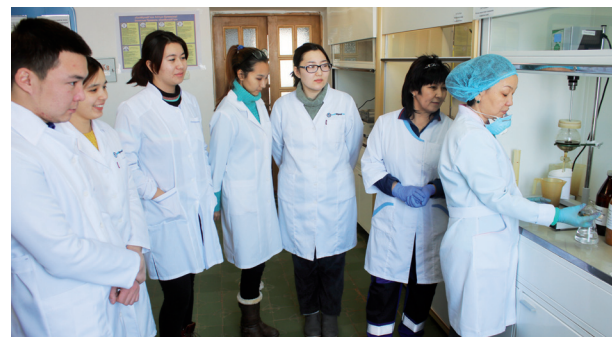
Болашақ мұнайшыларға арналған жаңа оқу жылы 7 бет