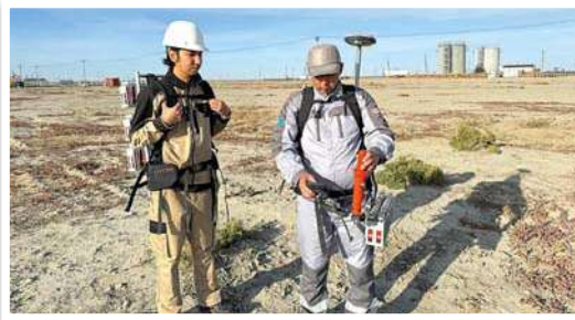
(Жалғасы. Басы – 1 бетте.)

Бір маман өзімен бірге 90 қабылдағышты алып, қондыра алады. Жалпы жүйе жоғары тығыздықтағы бақылау желісін орналастыруды жеңілдетеді. Бұл ретте тартылатын қызметкерлер саны 50% дейін азаяды, өнімділік 4 есе артады, дала жабыдығының салмағы 20 есе азаяды, дала техникалары бұрынғыдан 80% аз тартылып, дала жұмыстарының уақыты орта есеппен 30% қысқарады.